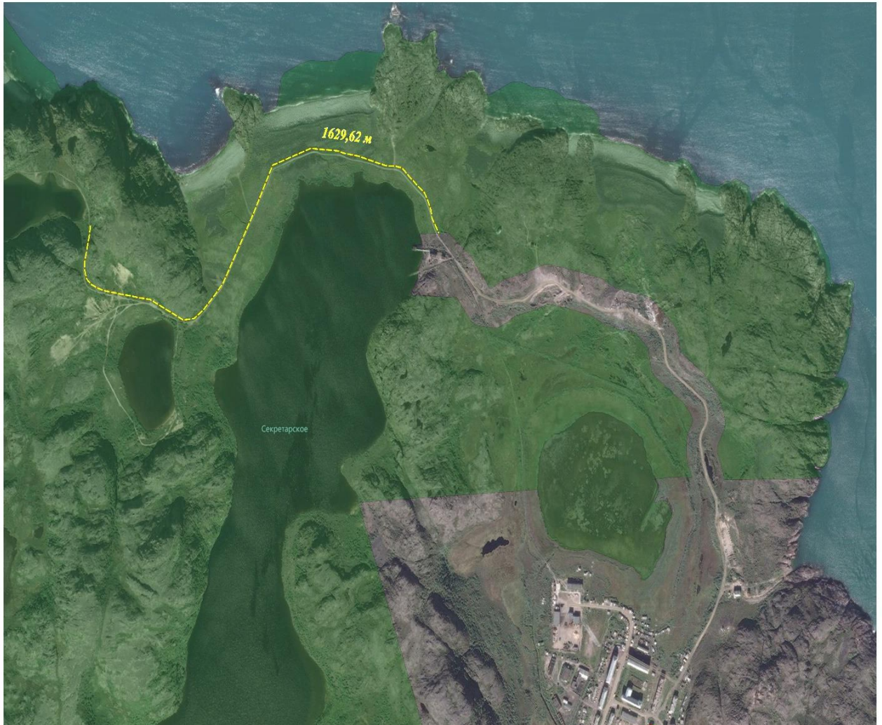
Схема проезда на мототехнике в зимний период времени на территории природного парка "Териберка"

Обозначения: ■ Территория парка --- организованный проезд